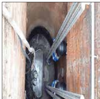
Pumpwerk von innen neu