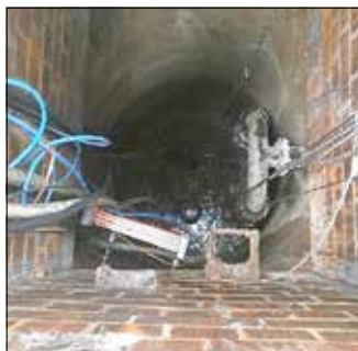
Pumpwerk von innen (4 m tief) alt