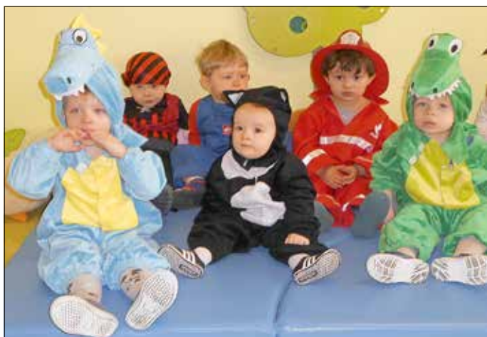
Minizwergengruppe Kita Kasel-Golzig

Da sich die Kinder sehr gern verkleiden und bereits einige schon vorsorglich neue Kostüme gekauft oder selbst geschneidert hatten, haben sich alle Erzieherinnen zusammengesetzt und überlegt, ob Fasching unter besonderer Beachtung der Coronaregeln stattfinden kann. Alle waren sich einig, die Faschingsfeier nicht ausfallen zu lassen! Alle Gruppen feierten in diesem Jahr separat, im eigenen Gruppenraum. Dafür schmückten die Erzieherinnen, gemeinsam mit den Kindern, die Räume mit Luftschlangen, Luftballons und Girlanden. Das freute alle Kinder sehr!