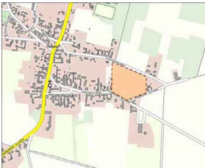
Abbildung 1: Übersicht zur Lage des Plangebietes