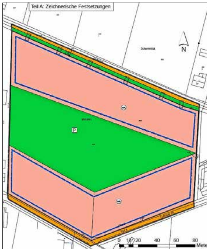
Abbildung 2: Zeichnerische Festsetzungen