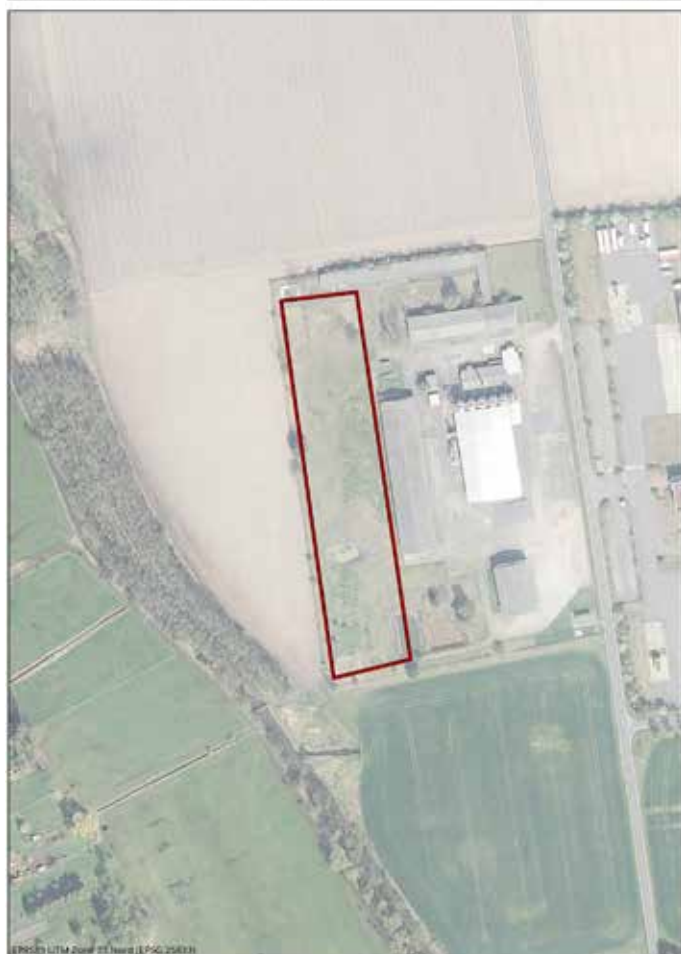
Gemeinde Kasel-Golzig Bebauungsplan Freiflächen-Photovoltaikanlage Kriebitzer Weg Legende DOP M 1:2.500 (AA) August 2019

Formblatt „Informationspflichten bei der Erhebung von Daten im Rahmen der Öffentlichkeitsbeteiligung nach BauGB (Art. 13 DSGVO)“