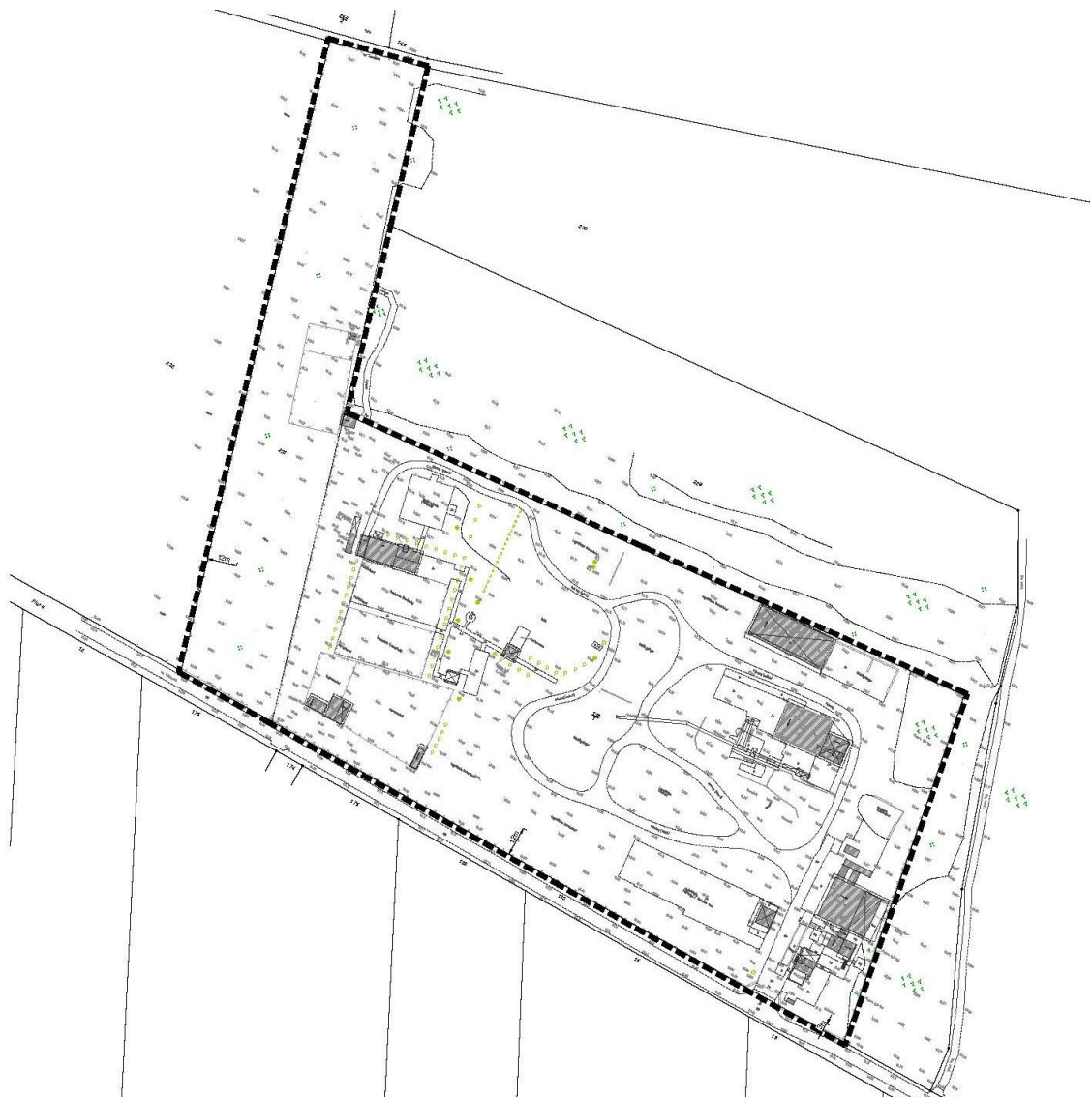
Geltungsbereich des Bebauungsplans „Recyclinganlage Schönwalde“