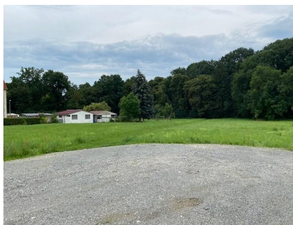
Ansicht von Ludwig-Renn-Straße