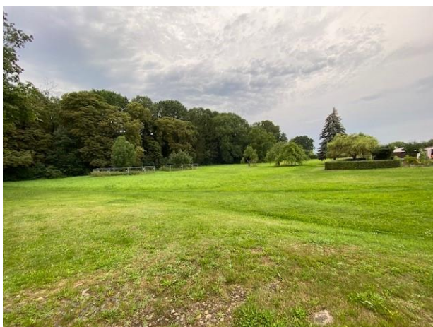
Ansicht von Parkstraße

Der entsprechende Vermessungsantrag ist vom Käufer zu stellen. Die Vermessungskosten trägt der Käufer.