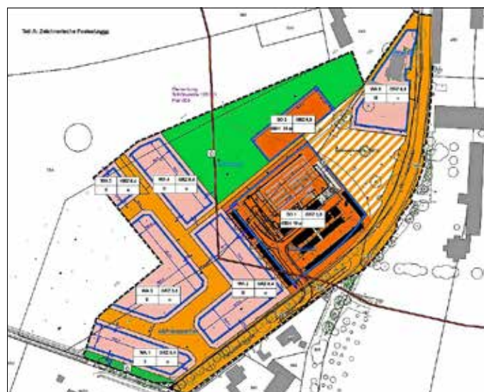
Abbildung: Geltungsbereich, o. M.

Die Verarbeitung von personenbezogenen Daten erfolgt auf Grundlage des § 3 BauGB in Verbindung mit Art. 6 Abs. 1 Buchst. e DSGVO und dem Brandenburgischen Datenschutzgesetz. Sofern Sie ihre Stellungnahme ohne Absenderangaben abgeben, erhalten Sie keine Mitteilung über das Ergebnis der Prüfung. Weitere Informationen entnehmen Sie bitte dem Formblatt: Informationspflichten bei der Erhebung von Daten im Rahmen der Öffentlichkeitsbeteiligung nach BauGB (Art. 13 DSGVO), welches mit ausliegt.