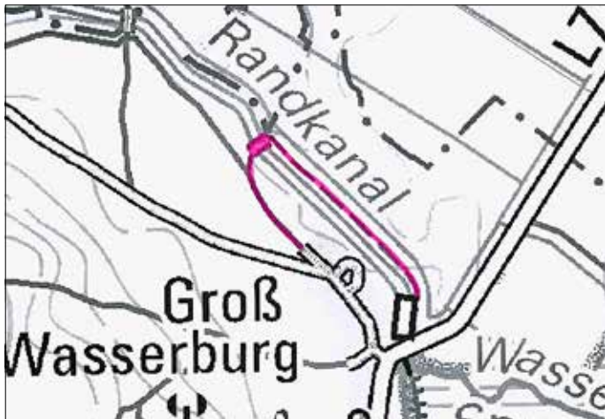
Skizze zur Straßenwidmung