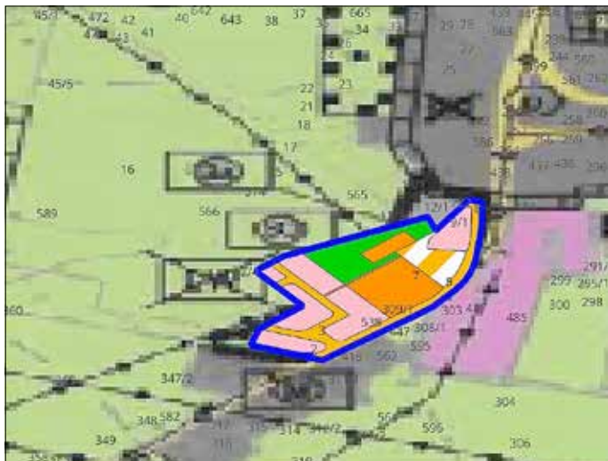
Abbildung: Geltungsbereich, o. M.