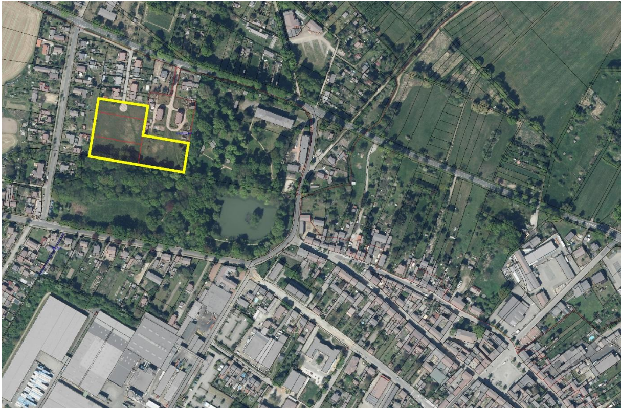
Abbildung 1: Archikart Luftbild Plangebiet